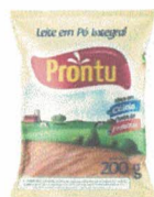
LEITE INTEGRAL PRONTU 200G

A título de diligência, e possível indicação de marca, fomos verificar a composição da marca do leite em pó integral apresentado pela recorrente, qual seja o da marca PRONTU 3 .