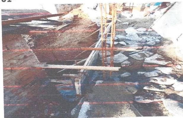
MURO DE ARRIMO